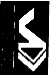
image001.jpg 2 KB

< http://www.vazestacionamentos.com.br > http://www.vazestacionamentos.com.br